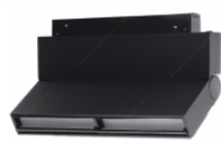
پروژکتور مگنتی ۶ وات لنا افراتاب مدل F.LIA