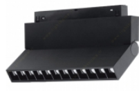
پروژکتور مگنتی ۱۲ وات لنا افراتاب مدل A.LIA