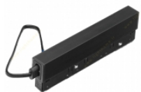
دراپور ۱۰۰ وات ۴۸ ولت لنا افراتاب مدل D.LIA