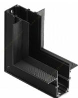
ریل مگنتی LRWC لنا افراتاب مدل LRWC.LIA