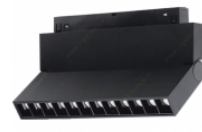
پروژکتور مگنتی ۶ وات لنا افراتاب مدل A.LIA